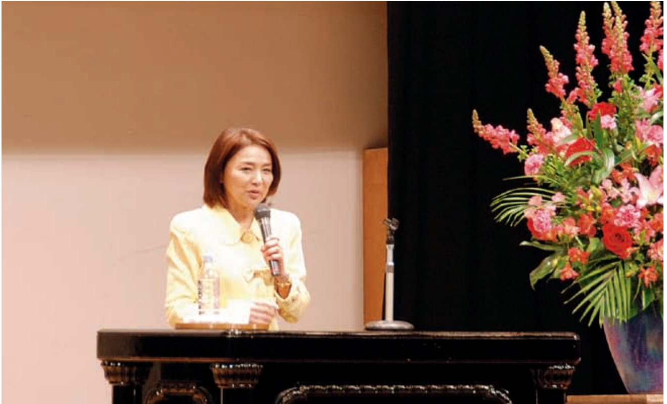
環境市民530大集会講演会

〔URL http://www.530.toyohashi.aichi.jp E-mail 530@city.toyohashi.lg.jp 〕